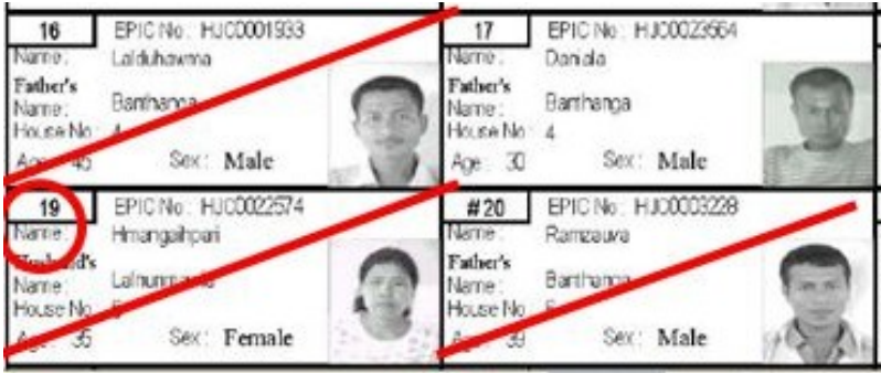
Transgender വോട്ടർ ആണെങ്കിൽ T എന്ന് രേഖപ്പെടുത്തിയാൽ മതി.

4. വോട്ടർപട്ടികയുടെ MARKED COPY യിൽ പുരുഷ വോട്ടർ ആണെങ്കിൽ വോട്ടറെ സംബന്ധിക്കുന്ന ഭാഗം ഇടത് താഴെ കോണിൽ നിന്ന് മുകളിലോട്ട് വലതു മുകൾ ഭാഗത്തെ കോണ് വരെ കുറുകെ വരയ്ക്കണം. വനിതാ വോട്ടർ ആണെങ്കിൽ കുറുകെ വരയ്ക്കുന്നത് കൂടാതെ വോട്ടർ പട്ടികയിലെ ക്രമനമ്പറിന് ചുറ്റും വൃത്തം കൂടി വരയ്ക്കണം.